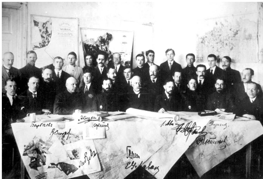
Metsakorralduse büroo 1920