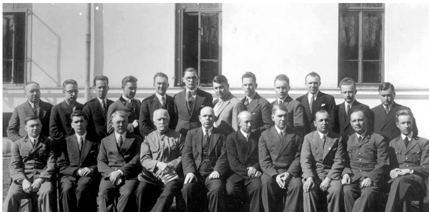
Metsakorralduse büroo 4. mai 1934. a..